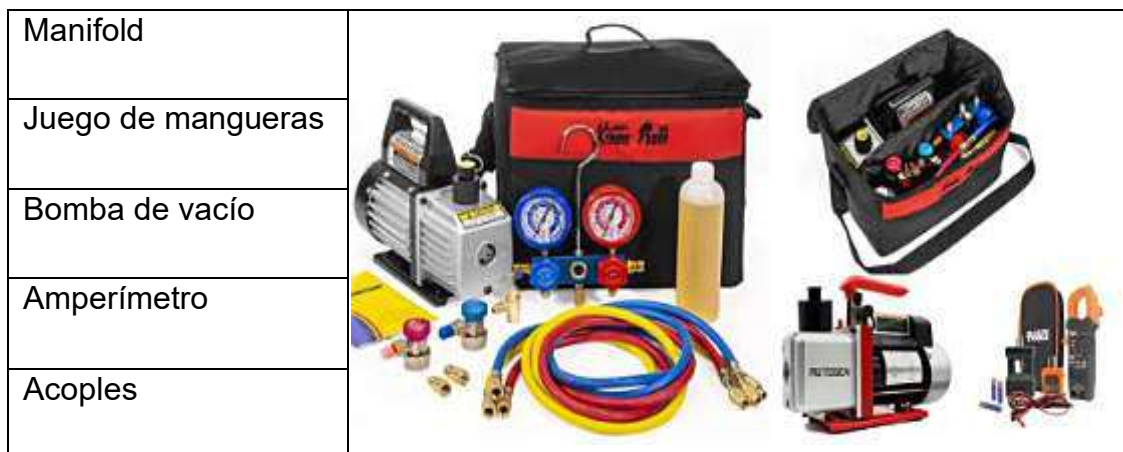
TABLA 2 Refrigerantes HFC – Ozon Action Kigali Fact Sheet