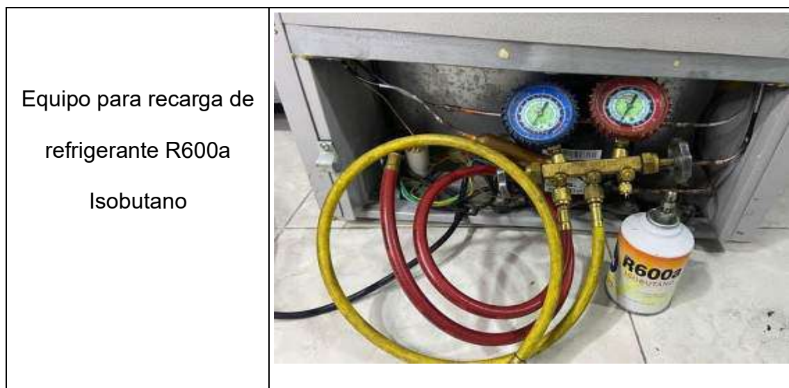
TABLA 3 Equipo para recarga de refrigerante.