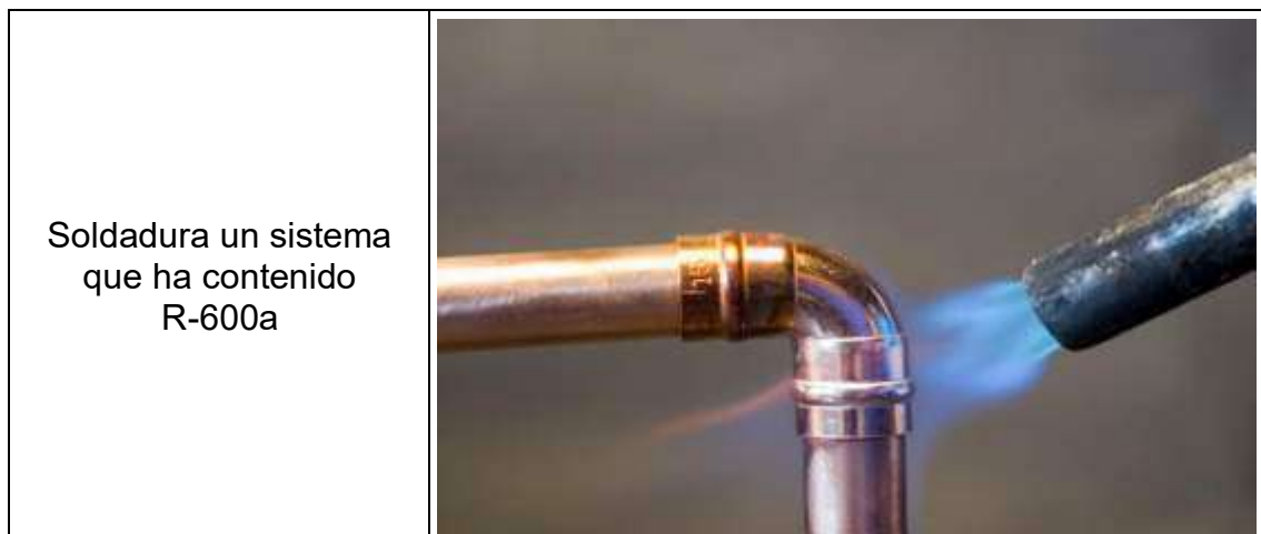
TABLA 4 Equipo para soldadura

Para soldar el sistema R-600a, es indispensable primero ventilar y recuperar completamente los vapores; luego, durante todo el proceso de soldadura, se debe mantener un barrido obligatorio de Nitrógeno ( N_2 ) a 2-3 PSI para desplazar el refrigerante inflamable y el oxígeno, evitando así cualquier ignición y la formación de contaminantes. Por lo tanto, soldar un sistema que ha contenido R-600a es el procedimiento de mayor riesgo y debe evitarse en lo posible (usando Lokring). Si es estrictamente necesario (ej. cambiar un compresor o un filtro de fábrica) (García Mena, 2024).