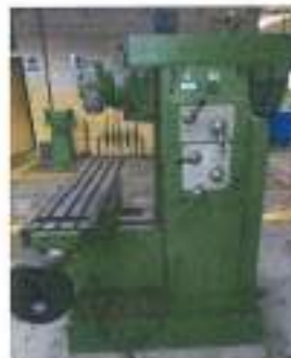
Ilustración 1: La fresadora universal FEXAC N.º 9

La repotenciación, también conocida como rehabilitación o modernización de maquinaria, consiste en intervenir equipos antiguos para restaurar o mejorar su rendimiento original. Este proceso puede incluir la sustitución de componentes eléctricos, actualización de sistemas de control, rediseño de partes mecánicas y corrección de defectos estructurales (Chryssolouris, 2006).